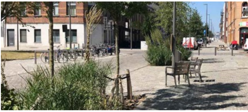
Bilden är ett exempel från annan plats på hur en lågfartsgata kan se ut.