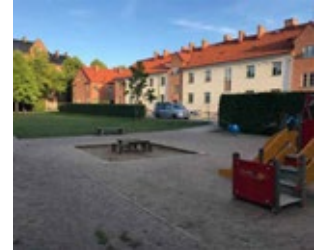
Bilden är ett exempel på hur ett grönt lektorg kan se ut.

De gröna lektorgen får en mjuk och grön gestaltning med få hårdgjorda ytor och avgränsas tydligt från omgivningen med bland annat halvhöga häckar och andra planteringar.