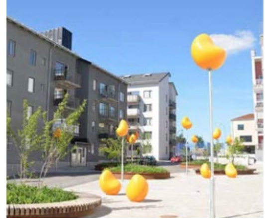
Bilden är ett exempel från annan plats på hur en körbar torgyta kan se ut med en blandning av konstverk och planteringar.

Lågfartsgatan utformas med kör- och gångbanor i marksten som avskiljs med planteringar, gatuträd, cykelparkeringar, belysning, pollare och parkeringsplatser.