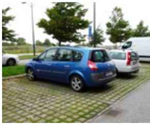
Exempel på hur en gräsarmerad parkeringsplats kan se ut.

Här kommer en körbar torgyta som skiljs av och markeras med bland annat konstverk, planteringar, sittplatser samt gatuträd ligger.